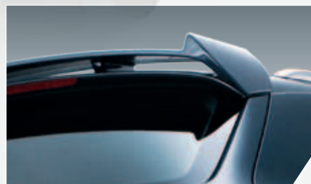
ABT Heckflügel. Kraftvolles Design, perfekte Aerodynamik.

Wie Sie ihn auch drehen und wenden: Der ABT Q5 macht aus jeder Perspektive mächtig Eindruck. Allein der imposante Frontgrill und die kraftvollen Kotflügelverbreiterungen geben ein klares Statement ab. Mindestens ebenso markant: die Frontschürze sowie die stimmig gestaltete Heckschürze, die mit zwei Handgriffen der herausfahrbaren Anhängerkupplung Platz bietet. Der kompakte Bruder des ABT Q7 ist eben nicht nur attraktiv, sondern auch höchst praktisch veranlagt und damit der ideale Gefährte für alle Fälle. Was auch immer Sie vorhaben – der ABT Q5 setzt Sie souverän in Bewegung.