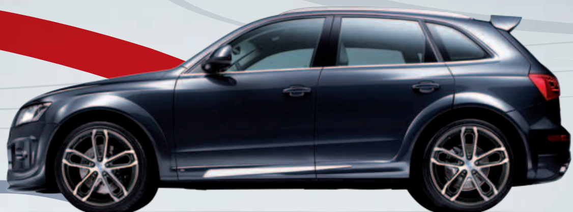
ABT CR Sportfelge. Leicht, souverän, formvollendet und unendlich kraftvoll.