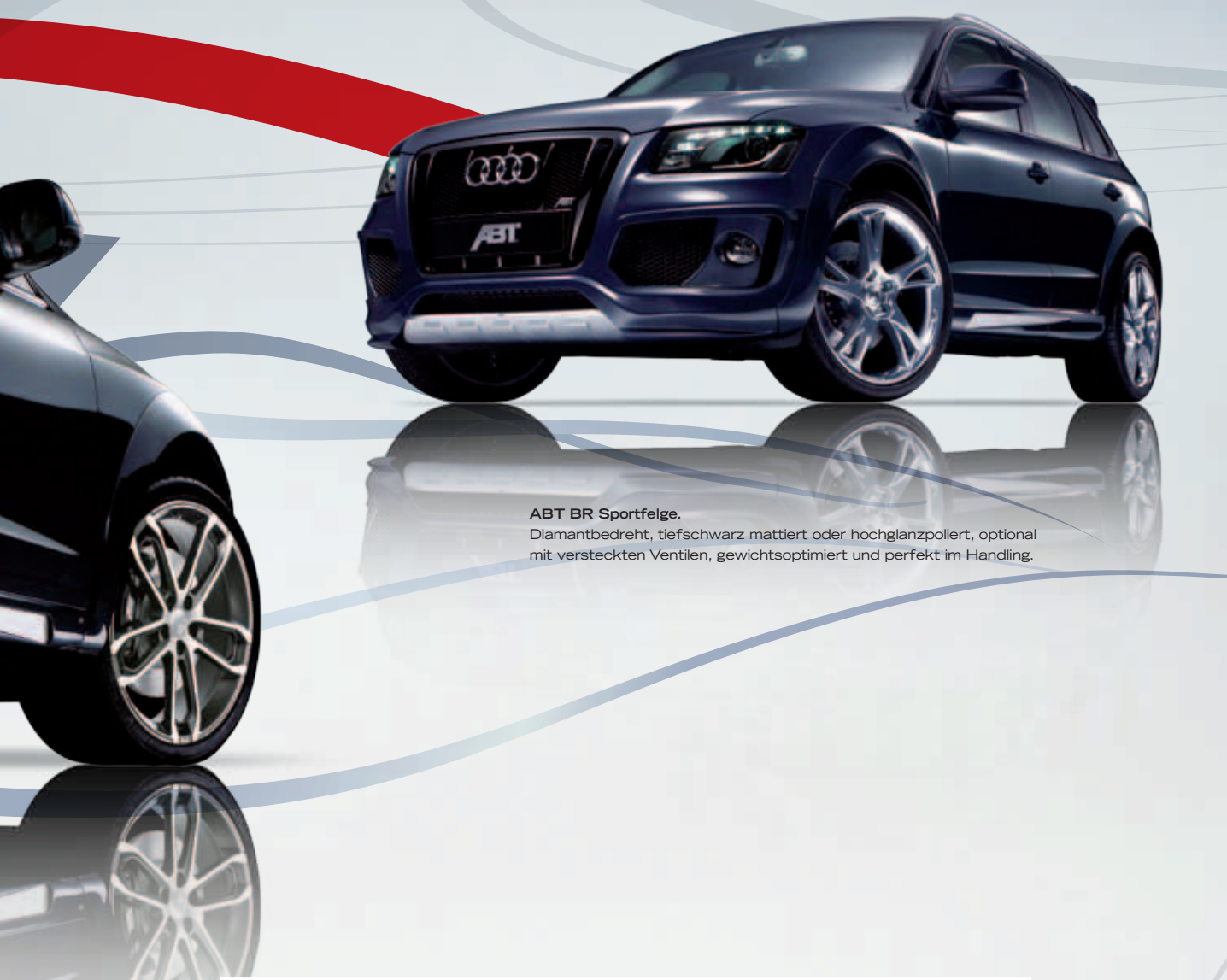
ABT BR Sportfelge. Diamantbedreht, tiefschwarz mattiert oder hochglanzpoliert, optional mit versteckten Ventilen, gewichtsoptimiert und perfekt im Handling.