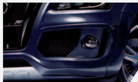
ABT Frontschürze. Energiegeladene Exklusivität in Erstausrüster-Qualität.