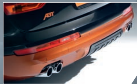
ABT Heckschürze. Inklusiv ABT 4-Rohr-Endschalldämpfer.