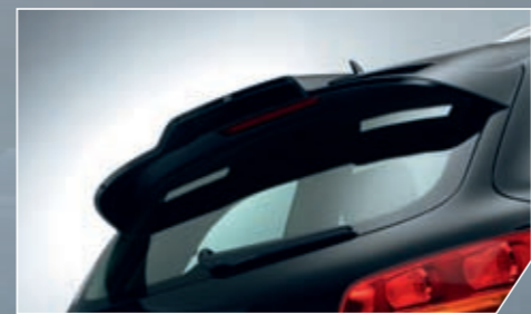
ABT Heckflügel. Dynamisch-dezente Eleganz.

Was macht noch mehr Eindruck als ein getunter SUV? Ganz einfach: ein SUV mit Leistungswerten, die eines Sportwagens würdig sind. Wie der ABT AS7-R. 500 PS, von 0 auf 100 km/h in 5,9 Sekunden und 260 km/h Spitzengeschwindigkeit. Für ein Fahrzeug mit den Dimensionen eines Audi Q7 wahrlich faszinierende Werte. Beschleunigen oder Cruisen, auf der Autobahn oder offroad – der ABT AS7-R zeigt überall und in jedem Augenblick, dass sein Fahrer am Steuer eines Ausnahme-Fahrzeugs sitzt, für das normale Maßstäbe nicht gelten.