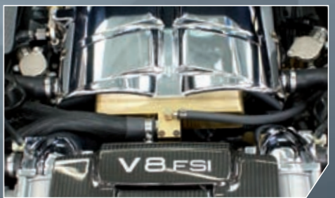
ABT Motortuning. Das reinste Kraftpaket: ABT Power R, die perfekte Kombination aus Chiptuning und Kompressor.