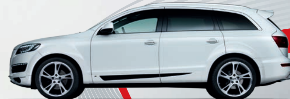
ABT CR Sportfelge. Diamantbedreht und Mystic Anthrazit mattiert. Leicht, souverän, formvollendet und unendlich kraftvoll.