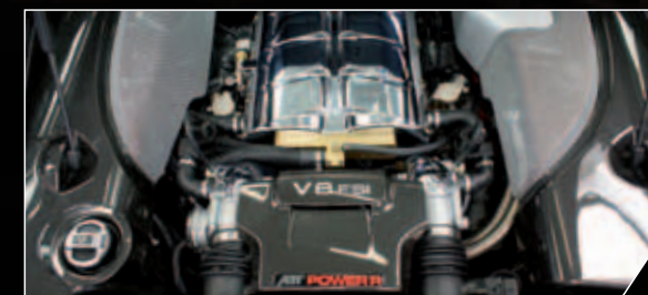
ABT Power R – Kompressorumbau auf 530 PS / 550 Nm