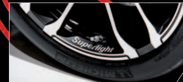
ABT CR SUPERLIGHT – Noch leichter, noch sportlicher. Die erste geschmiedete Felge von ABT.

Eine Frontschürze, die vor Kraft nur so strotzt. Ein extravaganter Heckflügel und eine Heckschürze, die vor allem eines sagen: „Auf Wiedersehen.“ Speziell entwickelte Sideblades und Seitenleisten. Und jede Menge Sichtkarbon. Wem beim Anblick dieses Meisterstücks die Tränen in den Augen stehen, der kann sich zumindest sicher sein: Dank 530 PS, 550 Nm und 311 km/h Spitze fließen sie schneller wieder ab, als sie gekommen sind.