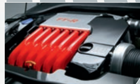
ABT Motortuning. Das reinste Kraftpaket: ABT Power R, die perfekte Kombination aus Chiptuning und Kompressor.