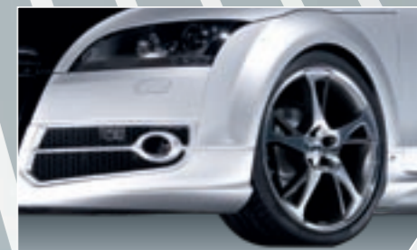
ABT BR Sportfelge. Diamantbedreht oder hochglanzpoliert, optional mit versteckten Ventilen, gewichtsoptimiert und perfekt im Handling.