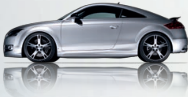
ABT AR Sportfelge. Diamantbedreht mit exklusivem Finish. Gewichtsoptimiert und anthrazit lackiert. Eine Klasse für sich.