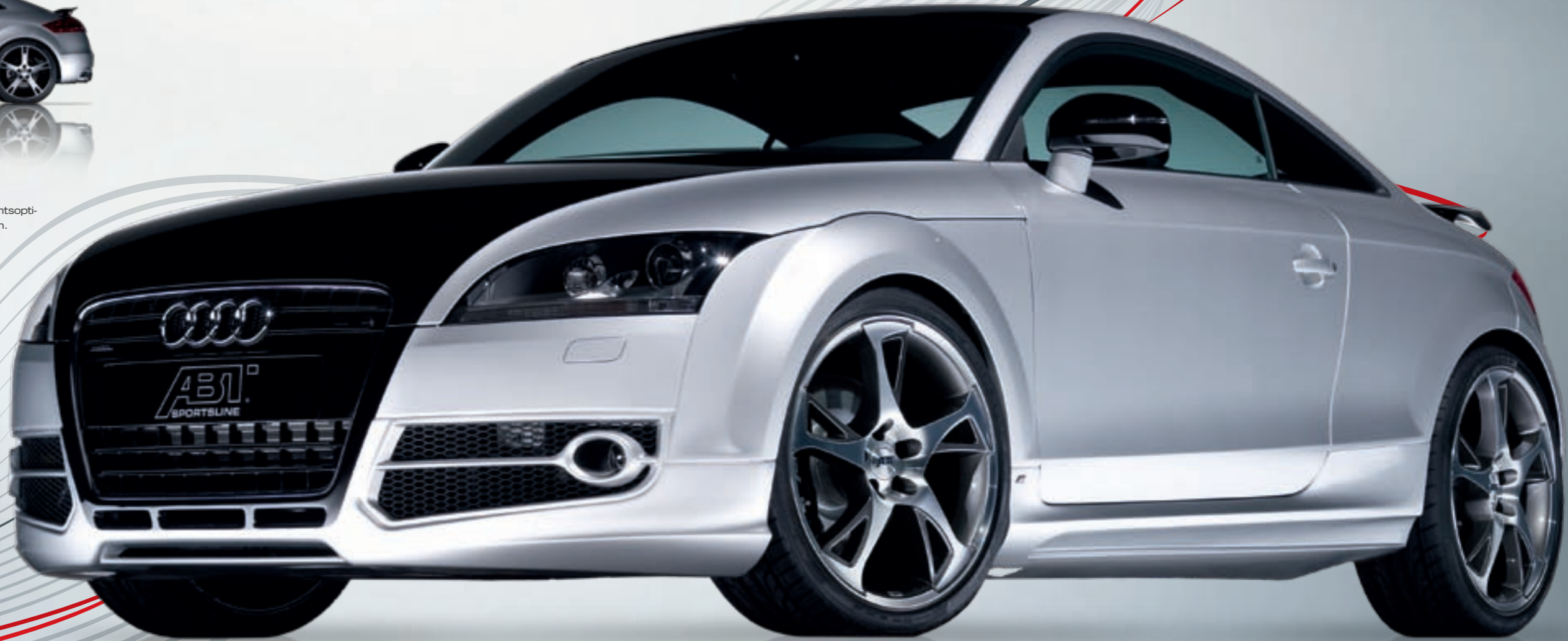
ABT BR Sportfelge. Diamantbedreht oder hochglanzpoliert, optional mit versteckten Ventilen, gewichtsoptimiert und perfekt im Handling.