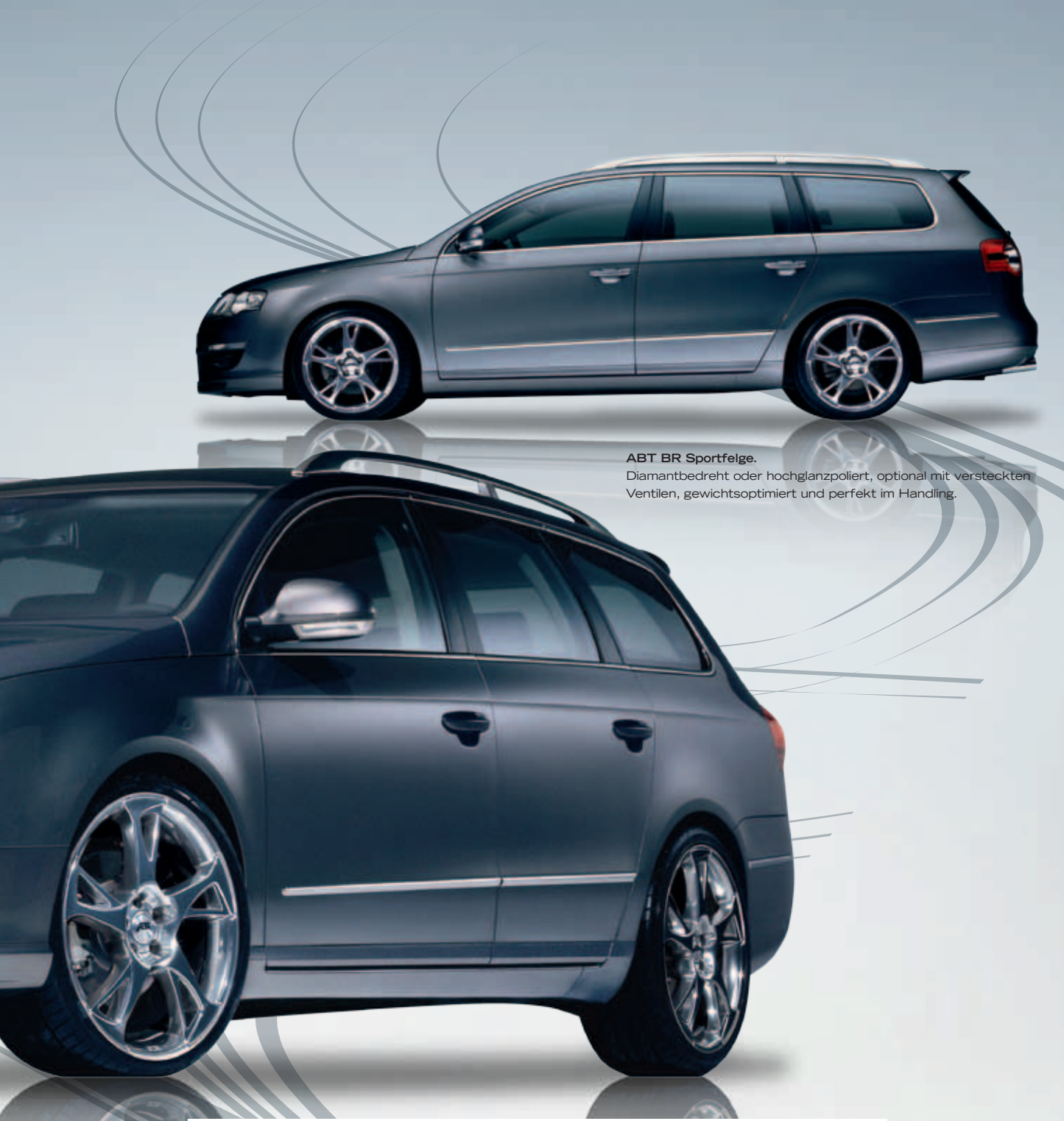
ABT BR Sportfelge. Diamantbedreht oder hochglanzpoliert, optional mit versteckten Ventilen, gewichtsoptimiert und perfekt im Handling.