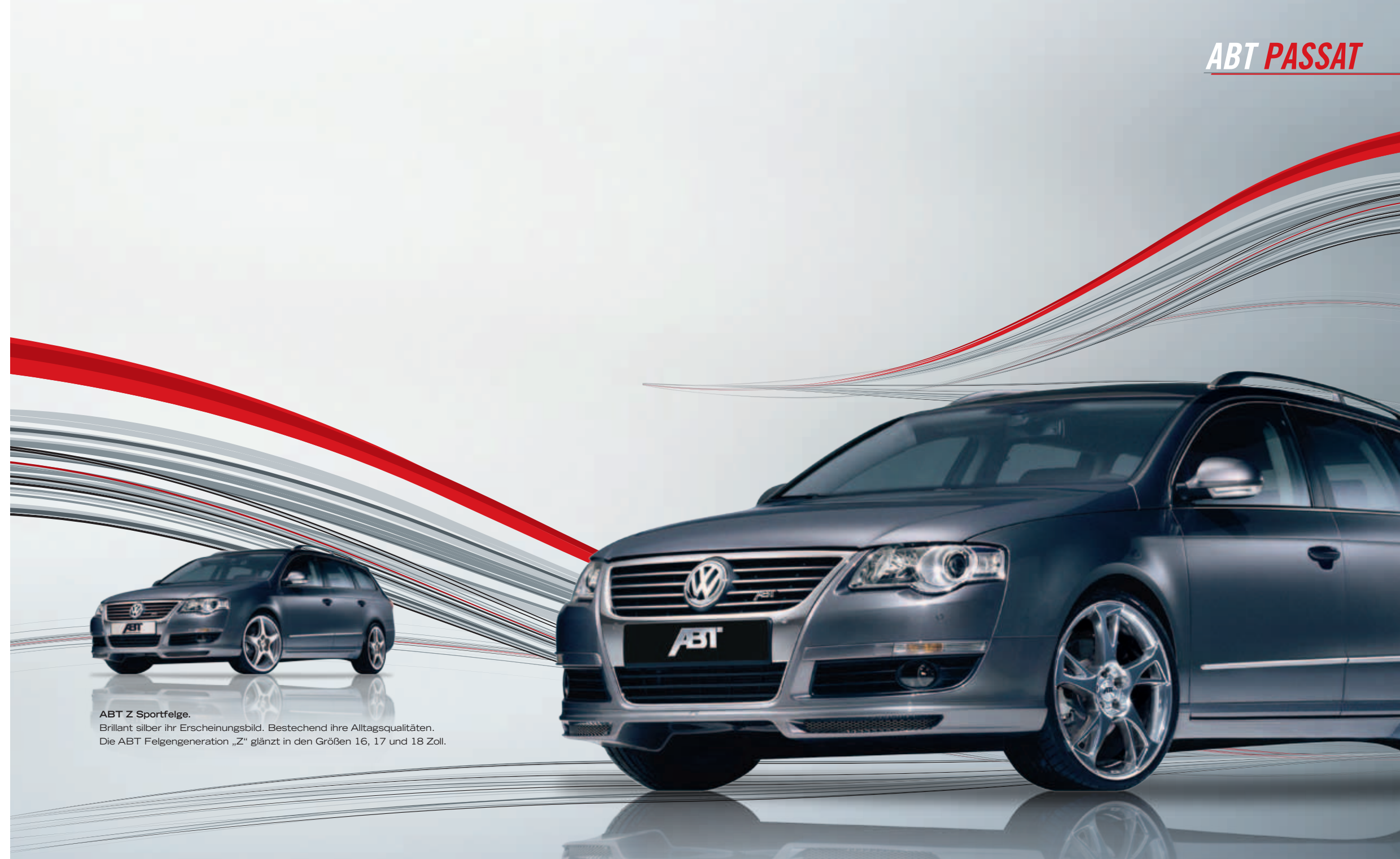
ABT Z Sportfelge. Brillant silber ihr Erscheinungsbild. Bestehend ihre Alltagsqualitäten. Die ABT Felgengeneration „Z“ glänzt in den Größen 16, 17 und 18 Zoll.