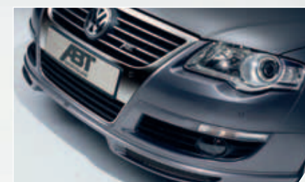
ABT Frontspoilerlippe. Verleiht exklusiver Sportlichkeit ein ganz eigenes Gesicht.