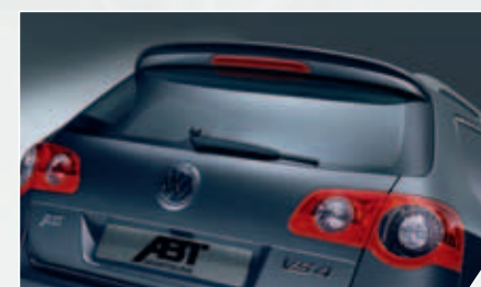
ABT Heckspoiler. Dynamisch-dezente Eleganz.

Geräumig, bewährt und mehrfach ausgezeichnet – der VW Passat ist ein echter Wertarbeiter mit Format. Und wir sind der Meinung, dass er aufgrund dieser überzeugenden Leistungen deutlich mehr verdient hat als nur den „Basistarif“. Deshalb befördern wir ihn hiermit zum anerkannten Dynamiker. Seine Erfolgsprämien: Chiptuning, Turbolader, exklusive Karosseriekomponenten, Sportfelgen, Tieferlegung und ISC-Fahrwerk. Das verstehen wir bei ABT unter einem kräftigen Karriereschub.