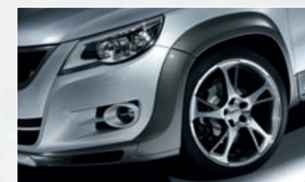
ABT BR Sportfelge. Diamantbedreht oder hochglanzpoliert, optional mit versteckten Ventilen, gewichtsoptimiert und perfekt im Handling.