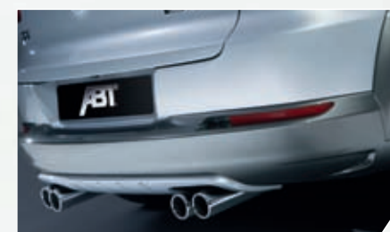
ABT Heckschürzenset. Mit verchromtem 4-Rohr-Endschalldämpfer aus Edelstahl.