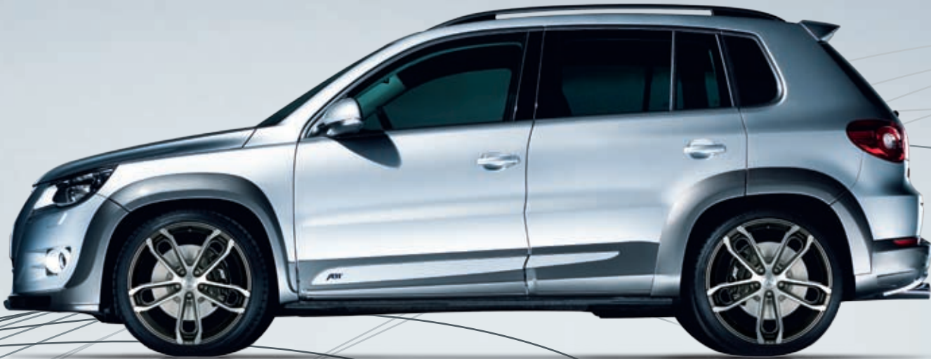
ABT CR Sportfelge. Leicht, souverän, formvollendet und unendlich kraftvoll – in Mystic Anthrazit matt